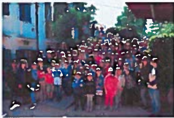
Sudionici Prolječa u Ronjgima