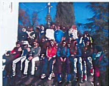
Posjeti učenika osnovnih škola