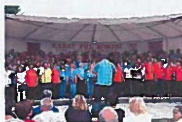
Kanat pul Ronjgi