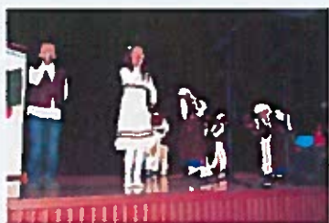
Predstava učenika Iovranske škole