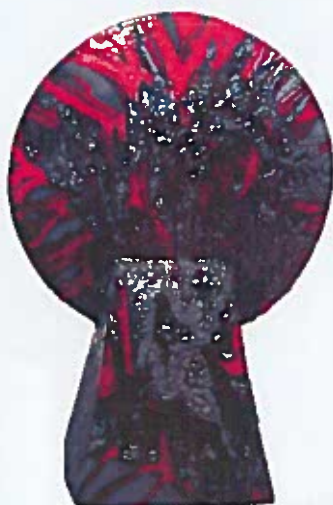
Keramička skulptura – tema: Glagoljica