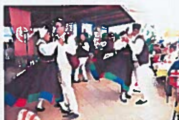
Mantinjada pul Ronjgi