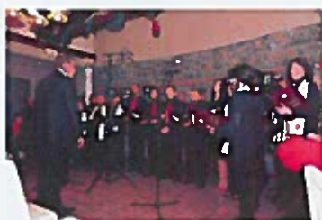
Katedra čakavskih pjesnika