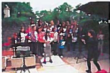
Proljeće u Ronjgima