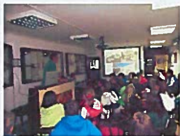
Učenici OŠ Kantrida