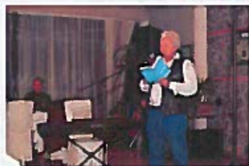
Katedra čakavskih pjesnika