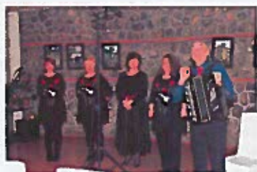
Večer pul Matetićevega ognjišća