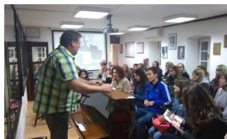
Posjeti učenika glazbene škole