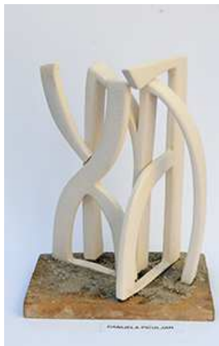
Keramička skulptura – tema: Glagoljica (MIR)

potpomogli: Ministarstvo kulture RH, HDS ZAMP, Općina Viškovo, Grad Kastav, Grad Opatija, Općina Matulji i Općina Dobrinj.