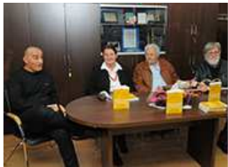
Večeri pul Matetićeve ognjišća predstavlanje knjige Milorada Stojevića