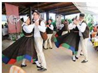
KUD „Barban“ – gosti Mantinjade