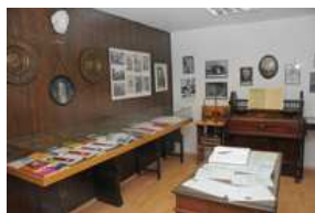
Spomen soba I.M. Ronjgova