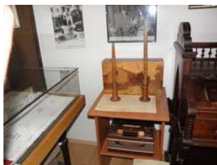
Detalj Spomen sobe