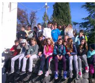
Posjeti učenika osnovnih škola