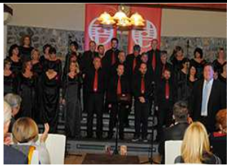
Peta obljetnica MPZ „Ronjgi“