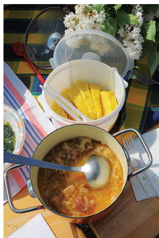
Delavska katedra – Naj zimski hrana Halubja