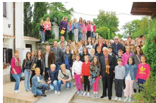
Sudionici Proljeća u Ronjgima