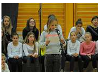
Predstavljanje Čakavčica pul Ronjgi 22