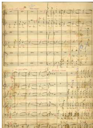
Autograf Ivana Matetića Ronjgova