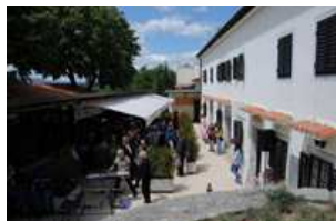
Spomen dom I. M. Ronjgova