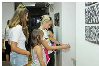
Izložba radova 1. keramičke kiparske kolonije