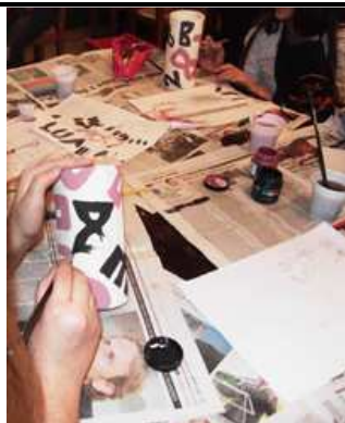
Izrada keramičkih vaza