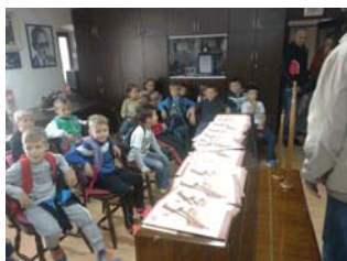
Posjet učenika prvih razreda OŠ "Sveti Matej"