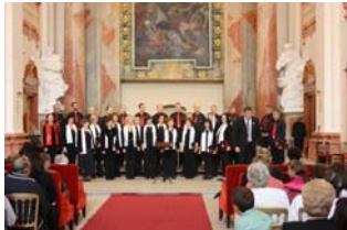
Koncert MPZ "Ronjgi"