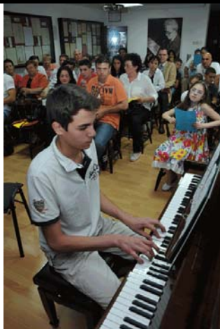
Koncert mladih glazbenika