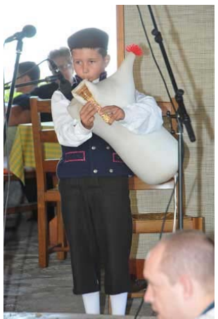
Mantinjada pul Ronjgi