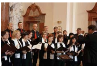
Koncert mladih glazbenika