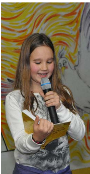
Nagrađeni učenici čitaju svoje radove