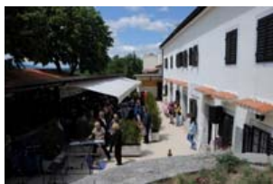
Spomen dom I.M. Ronjgova