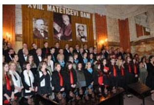
18. Matetićevi dani