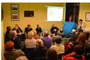
Zavičajna srijeda posvećena Zoranu Kompanjetu