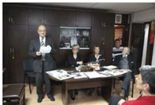
Obilježena 100. obljetnica rođenja prof.dr.sc. Vinka Tadejevića