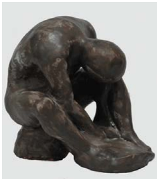
Rad u keramici autora Borisa Sušnja