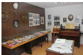
Spomen soba I.M. Ronjgova