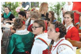
Nekadajne frizure - na Mantinjadi pul Ronjgi