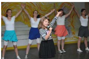
Čakavčiči pul Ronjgi proslavili 20. obljetnicu