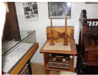
Detalj Spomen sobe